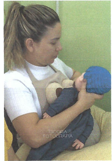
Nas fotos acima, as gestantes estão recebendo instruções sobre amamentação. Casa da Criança. Taubaté – SP.