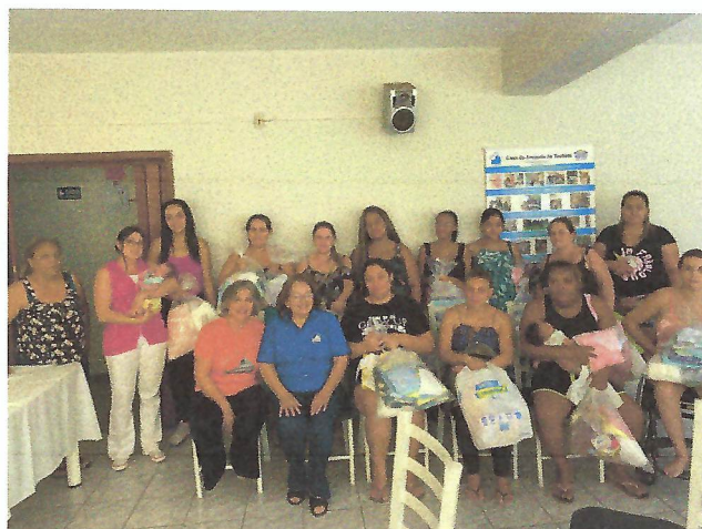
Na 1º foto, a enfermeira da Casa da Criança está prestando orientações sobre amamentação às gestantes atendidas pela Casa da Amizade. Na 2º foto, as gestantes receberam o enxoval de RN. Casa da Amizade. Taubaté – SP.