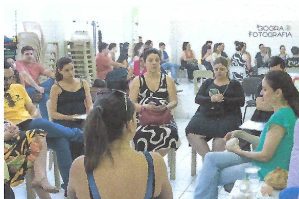
Nas fotos acima, a médica está orientando as gestantes durante o curso de amamentação, utilizando materiais pedagógicos educativos. Casa da Criança – Taubaté-SP