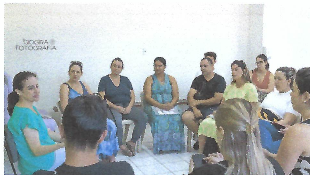
Nas fotos acima, a médica está orientando as gestantes durante o curso de amamentação. Casa da Criança – Taubaté-SP