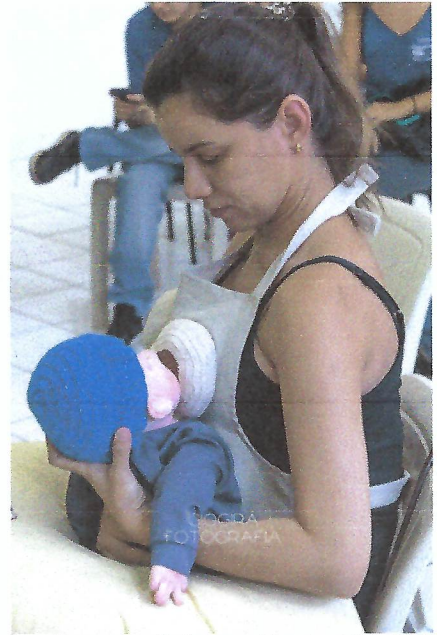
Nas fotos acima, as gestantes estão recebendo instruções sobre amamentação. Casa da Criança. Taubaté – SP.